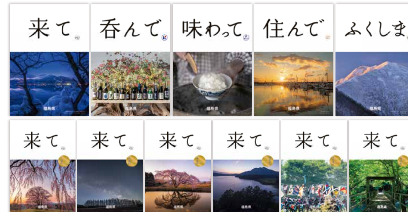
[ 2023年度 福島県公式イメージポスター5連・市町村版「来て。」ポスター6種 ]